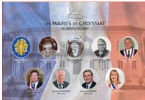
Inauguration du tableau des maires