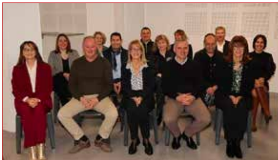
Le conseil municipal

Samedi 6 janvier 2024 : cérémonie des vœux de Madame le Maire et de son Conseil